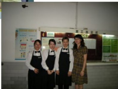
文化假日酒店实习

（二）由校企双方共同组建基地组织管理机构，成立校企共育人才工作委员会，共同制定或健全实践教学基地的教学运行、学生管理、安全保障等规章制度。